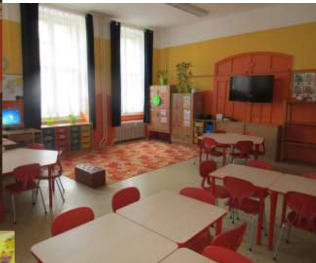
2. oddělení: BERÁNCI