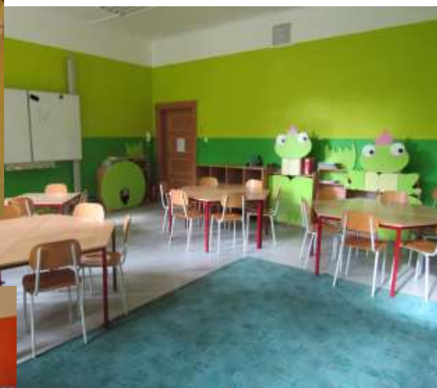
5. oddělení: ŽABKY