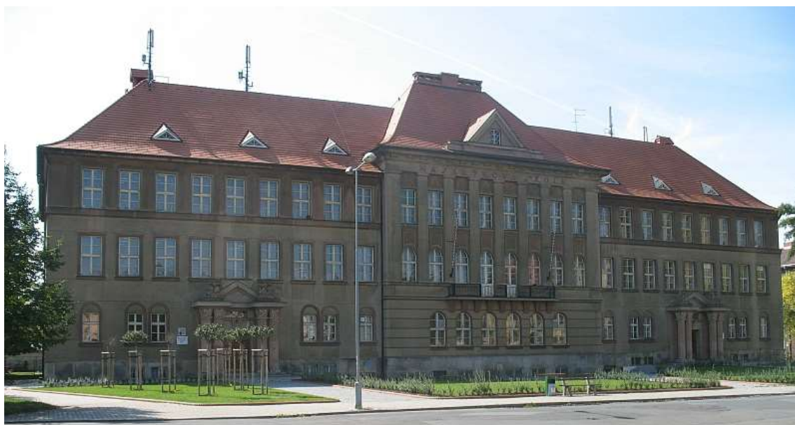
Budova Masarykovy ZŠ je dominantou Jiráskova náměstí v Plzni na Slovanech.