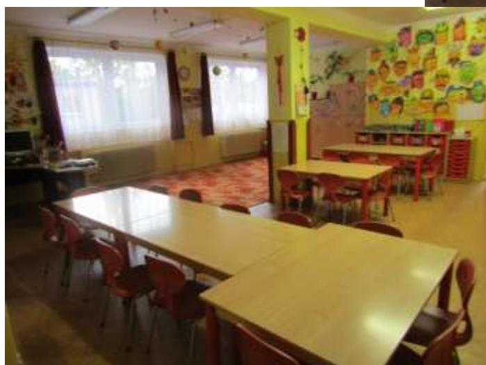
3. oddělení : BERUŠKY