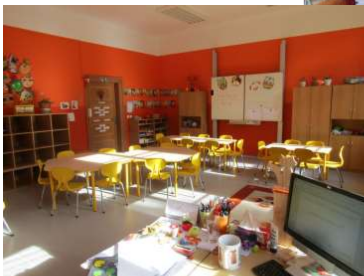
4. oddělení : LIŠIČKY