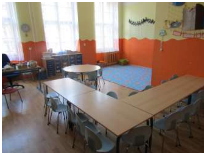
1. oddělení : SOVIČKY