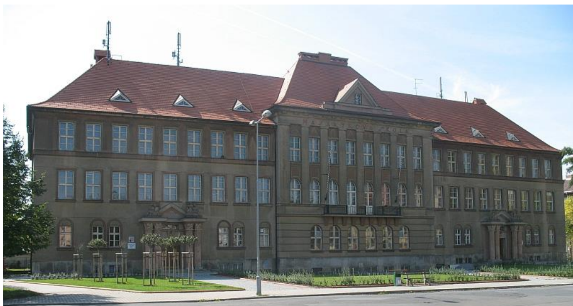
Budova Masarykovy ZŠ je dominantou Jiráskova náměstí v Plzni na Slovanech.